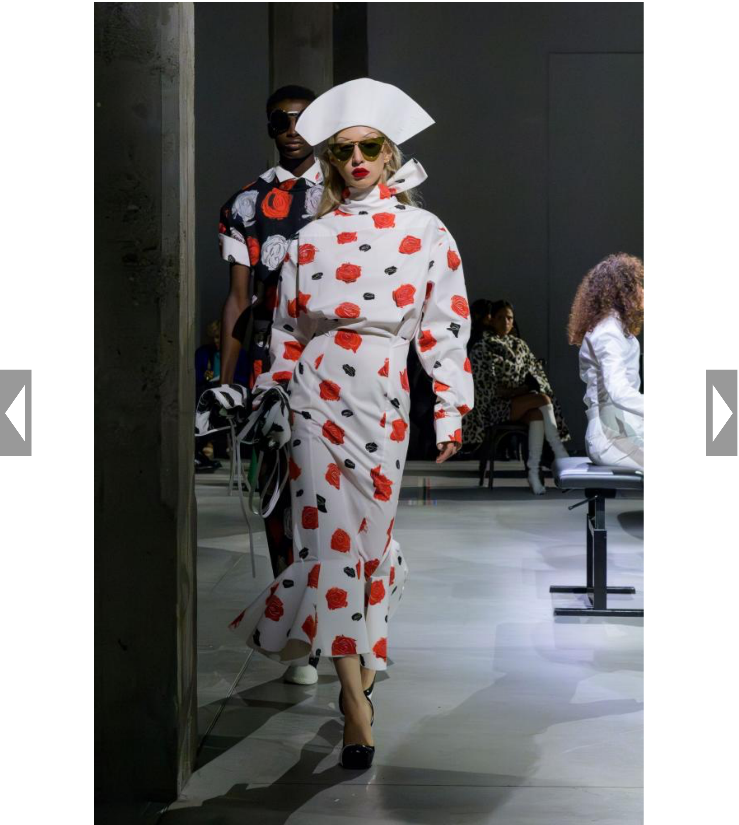
Entwurf von Anna Deller-Yee für Marni Frühling/Sommer 2025